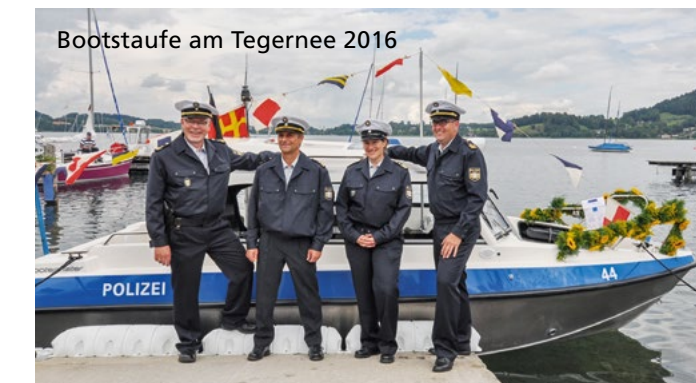
Bootstaufer am Tegernsee 2016